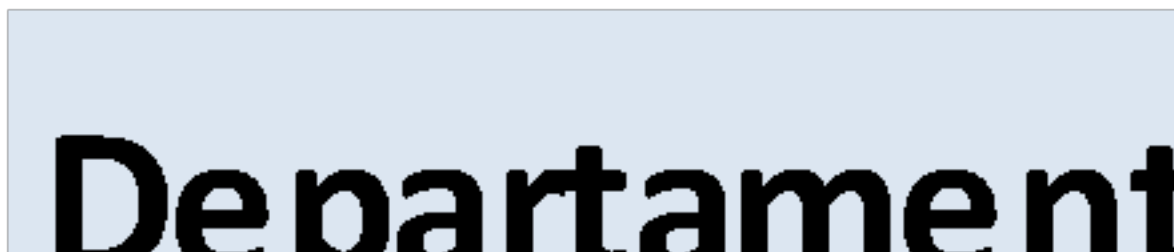
Cuadro 1. Distribución de sedes por departamentos y ciudades.

En total se cuenta con 17 sedes de las universidades en las diferentes regiones y ciudades: